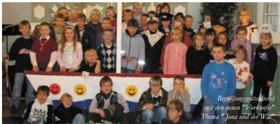
Begrüßungsgottesdienst mit den neuen "Vorkonfis" Thema "Jona und der Wal"